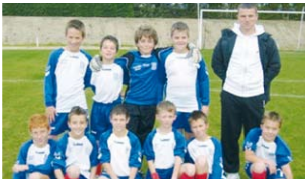
Equipe des benjamins qui monte en 1 ère Division

Le loto de l'OSG aura lieu cette année le Samedi 11 Avril dans la grande salle des Boulays, retenez dès à présent cette date.