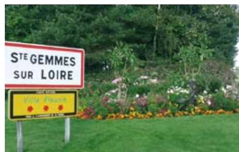
Ce concours a pour objectif de compléter l'effort de fleurissement réalisé par la Commune.

En participant à ce concours, et si vous le désirez, vous serez invités fin Avril à un atelier de fleurissement dirigé par l'équipe des Espaces Verts. Nous espérons que vous serez nombreux à participer à cette opération et c'est avec grand plaisir que nous vous recevrons en Mairie à l'automne prochain pour la remise des prix.