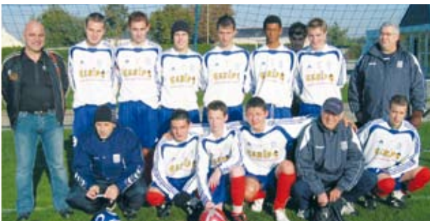
Equipe des 18 ans qui monte en Division Supérieure